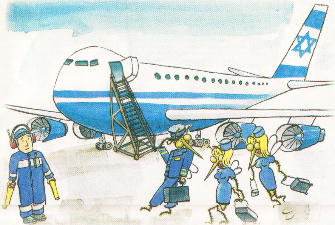
ILLUSTRATION: RUSSELL JACKSON