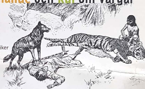
Varghunden av Jack London (Klassikerförlaget), Djungelboken av Rudyard Kipling (Klassikerförlaget), Gittan och grävvargarna av Pija Lindenbaum – en bilderbok för de yngre (Rabén & Sjögren). Vargfakta på nätet: www.de5stora.com